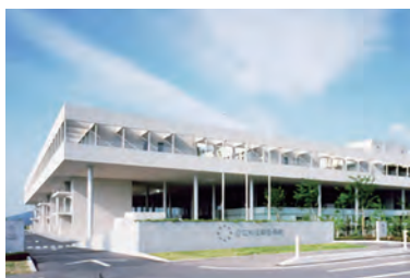
公立刈田総合病院