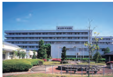
東北医科薬科大学病院