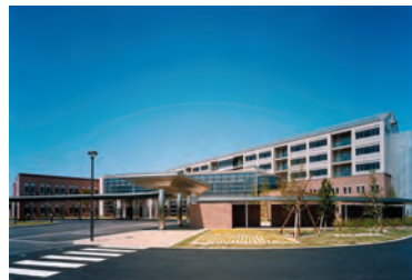
みやぎ県南中核病院