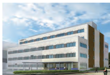
仙台循環器病センター