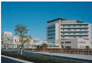
仙台オープン病院