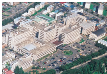
国立病院機構仙台医療センター