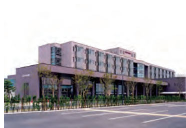
栗原市立栗原中央病院