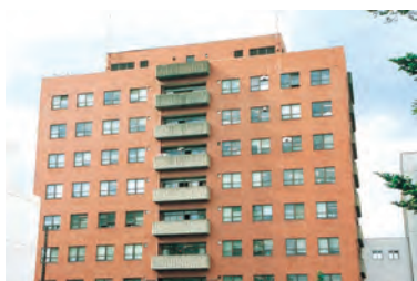
東北大学加齢医学研究所